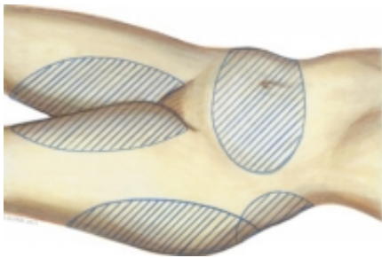
_ Fettabsaugung - Zur Liposuction geeignete Zonen

Wenn Sie sich einer Fettabsaugung unterziehen wollen, ist es wichtig, sich ausführlich über dieses Verfahren zu informieren. Die folgende Informationsschrift soll Ihnen erste Informationen zum Thema Fettabsaugung (Liposuction) geben. Es werden darin einige wichtige, aber bei weitem nicht sämtliche Aspekte der Methode der Fettabsaugung behandelt. Sie kann und soll nicht ein ausführliches und persönliches Gespräch in meiner Praxis ersetzen. Es ist aber für viele Patienten vorteilhaft manche Dinge zu Hause, in Ruhe nachlesen zu können.