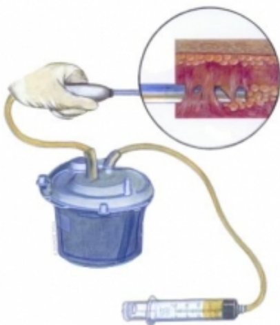
_ Fettabsaugung - Schema

Das Prinzip dieser Operationsmethode ist, dass über winzig kleine, nur wenige Millimeter große Hautschnitte, eine Metallkanüle (Metallröhrchen) ins Fettgewebe eingeführt wird. Diese Metallkanüle wird an eine Vacuumabsaugpumpe angeschlossen. Durch den, in dieser Metallkanüle erzeugten Unterdruck läßt sich Fettgewebe absaugen und damit Fettpölsterchen oder unästhetische Fettansammlungen reduzieren und die Oberflächenkontur neu formen. Der über den Fettpolstern gelegene Hautmantel selbst bleibt unangetastet. Aufgrund der Eigenelastizität der Haut schrumpft dieser Hautmantel, so dass keine Hautfaltenbildungen entstehen.