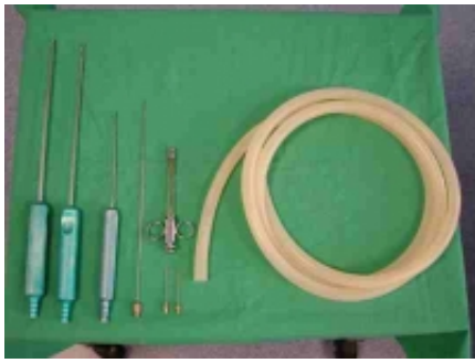
_ Fettabsaugung - Instrumentarium