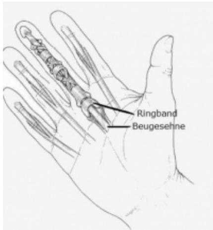
Schematische Darstellung der Ringbänder